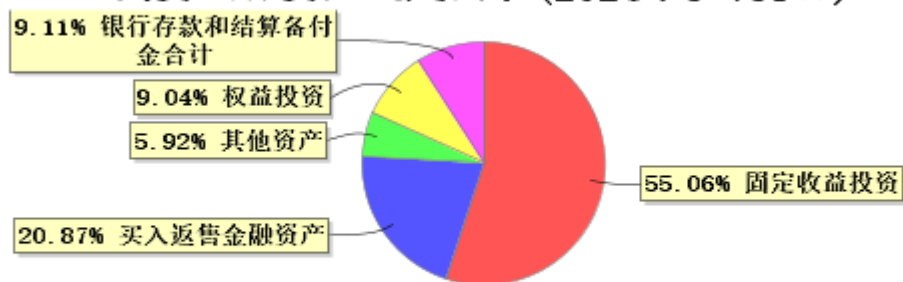
投资组合资产配置图表(2024年3月31日)

● 固定收益投资 ● 买入返售金融资产 ● 其他资产 ● 权益投资 ● 银行存款和结算备付金合计