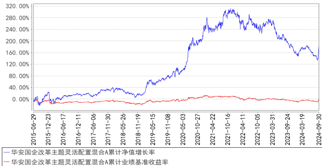
华安国企改革主题灵活配置混合A累计净值增长率与同期业绩比较基准收益率的历史走势对比图