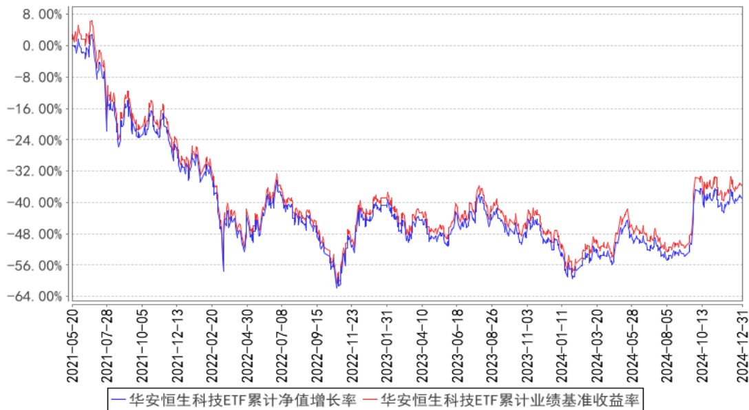
华安恒生科技ETF累计净值增长率与同期业绩比较基准收益率的历史走势对比图