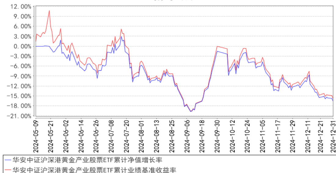
华安中证沪深港黄金产业股票ETF累计净值增长率与同期业绩比较基准收益率的历史走势对比图

注：本基金于 2024 年 05 月 09 日成立，截止本报告期末，本基金成立不满一年。