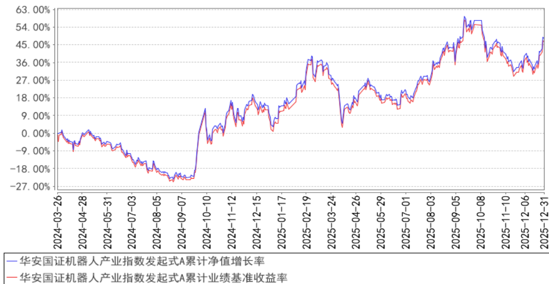
华安国证机器人产业指数发起式A累计净值增长率与同期业绩比较基准收益率的历史走势对比图