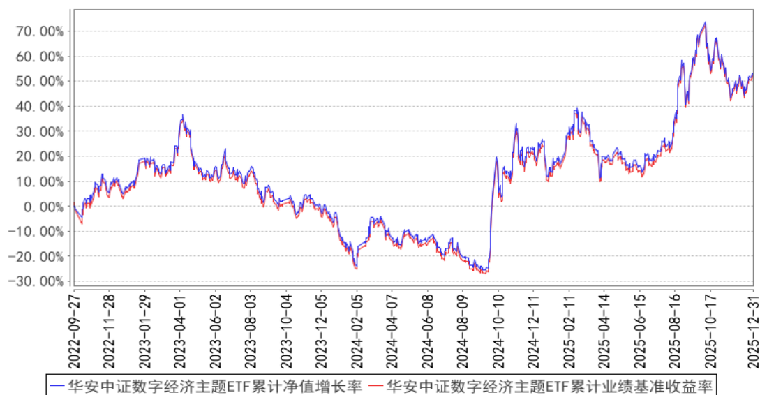
华安中证数字经济主题ETF累计净值增长率与同期业绩比较基准收益率的历史走势对比图