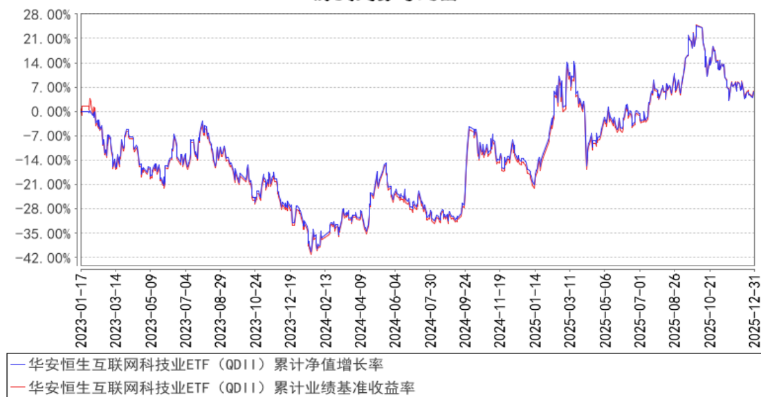
华安恒生互联网科技业ETF（QDII）累计净值增长率与同期业绩比较基准收益率的历史走势对比图