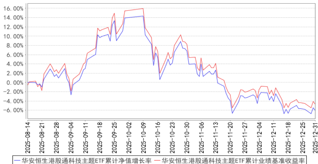
华安恒生港股通科技主题ETF累计净值增长率与同期业绩比较基准收益率的历史走势对比图

注：本基金于 2025 年 8 月 14 日成立，截止本报告期末，本基金成立不满一年。