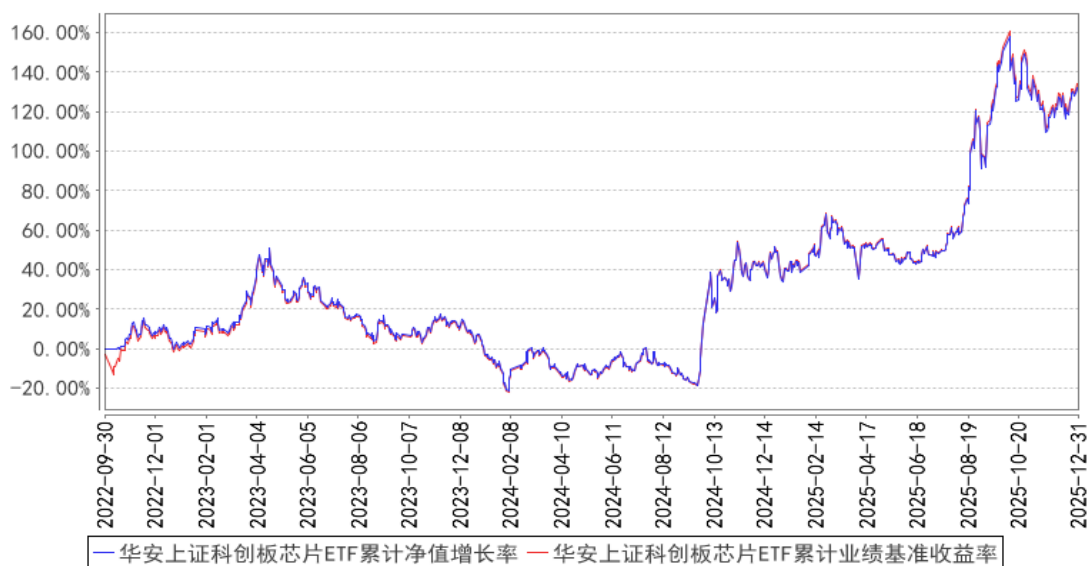
华安上证科创板芯片ETF累计净值增长率与同期业绩比较基准收益率的历史走势对比图